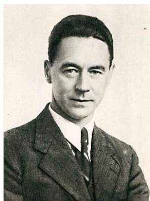
Gulbrand Lunde (1901-42)

Faggruppen har brukt lite penger i 2016.