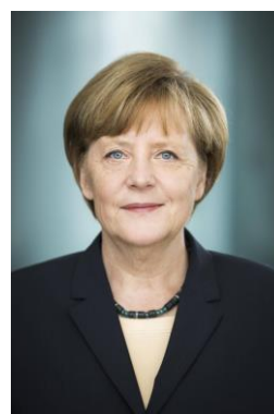
Angela Merkel (1954-)